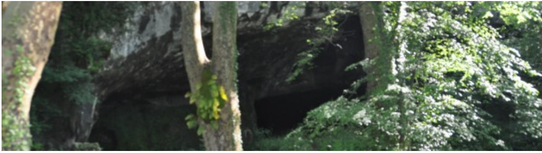
(Les grottes de Sare.)